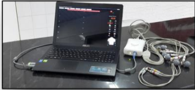
* الکترو کاردیوگرافی