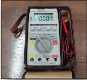
* تسلامتر محیطی