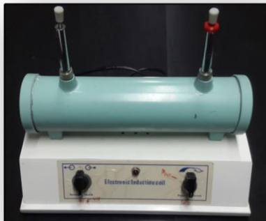
* ترانسفورماتور افزایشده